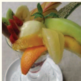
Fruits Parfait フルーツパフェ 旬のフルーツをふんだんに使用した 当店自慢の彩りパフェです。 ¥ 966