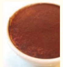
Tiramisu ティラミス ぶどう酒の香りの大人のティラミス