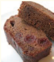
Pound Cake パウンドケーキ 自家製しっとりパウンドケーキ