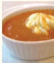
Cream caramella カスタードプリン なめらかプリンをクリーミーキャラメルで