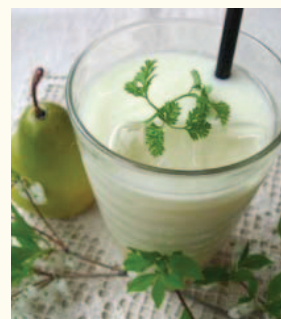
La France - Soy ラフランス・ソイ