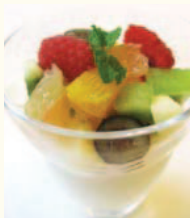
Panna Cotta パナナコッタ チェリーのお酒が薫るフルーツ添え