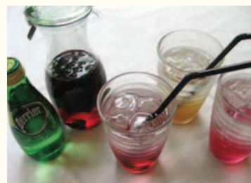
Perrier & Various Vinegars