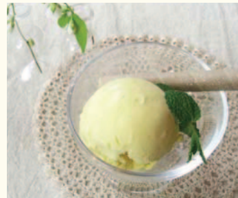
Vanilla Ice cream