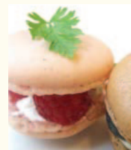
Maccaron マカロン 自家製カラフルマカロン