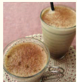
Soy - Chai 豆乳チャイ (Hot/Cold)