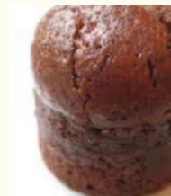
Torta al cioccolato フォンダンショコラ 温かいガナッシュ入りチョコレートケーキ